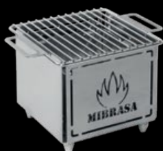
HIBACHI MH 150