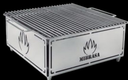
HIBACHI MH 300 PLUS