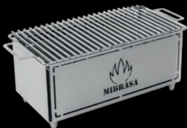
HIBACHI MH 300